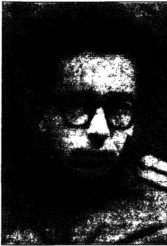
صورة اسماعيل كاداريه في شبابه